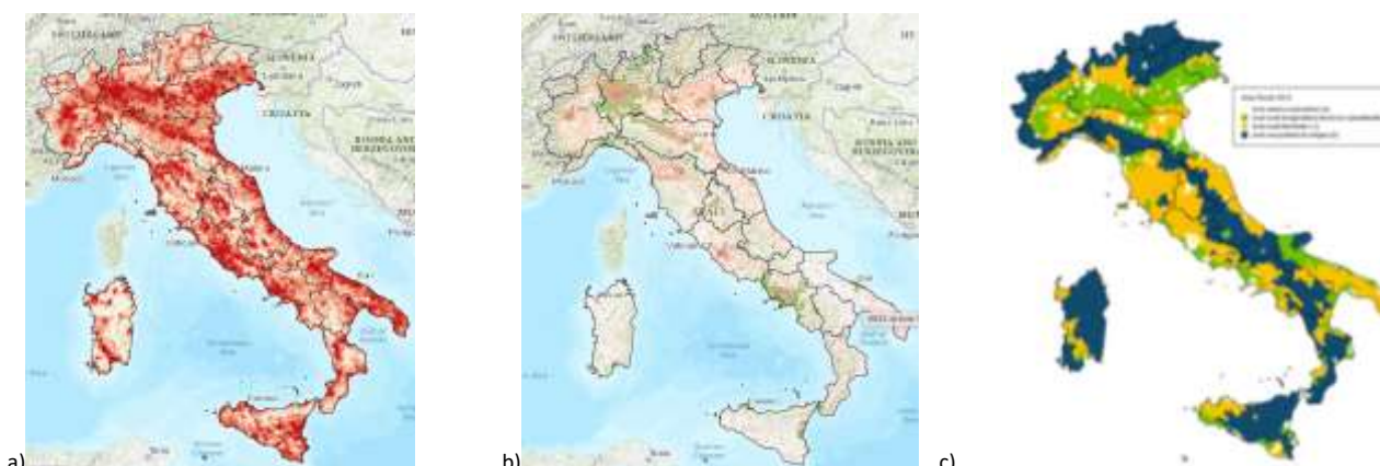
Figura 2 – Mappa della copertura 4G a) e fissa b) e delle aree rurali italiane

Nonostante l’alta offerta di soluzioni digitali da parte di imprese specializzate in IOT, in accordo all’ultima rilevazione ISTAT del 2016, solo un quinto delle aziende agricole italiane faceva uso di apparecchi elettronici e il controllo digitale della gestione o per la comunicazione e promozione era limitato al 5% del campione di indagine (Tab. 1).