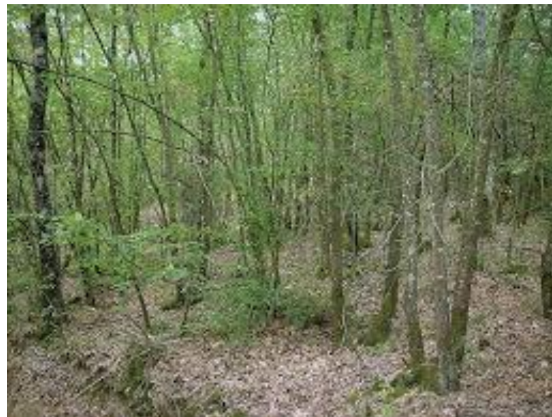
cedui invecchiati 2.904 ha