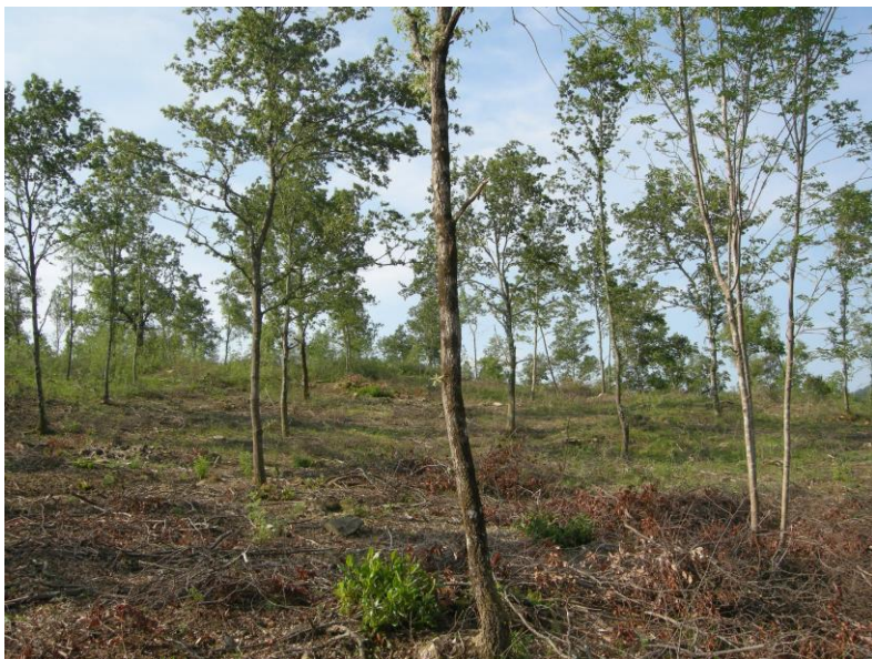
cedui a regime 6.318 ha

Cedui 9.242 ha (9,2 %) della sup. boscata